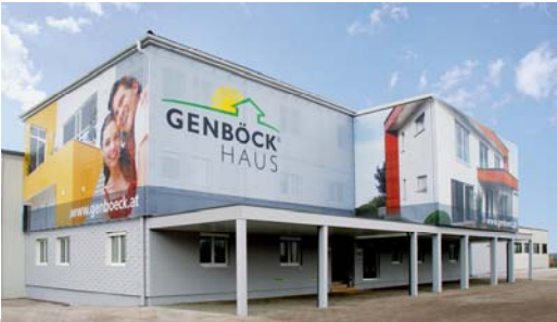
GENBÖCK HAUS Firmenzentrale Haag/Hausruck

GENBÖCK HAUS ist ein oberösterreichischer Familienbetrieb, der seit mehr als 20 Jahren auf die Planung und Errichtung hochwertiger Fertighäuser in Holzrahmenbauweise spezialisiert ist. Jedes Jahr werden am Standort Haag/Hausruck zu einem herausragenden Preis-Leistungsverhältnis rund 100 GENBÖCK HAUS-Häuser produziert, die sich neben der hohen Qualität vor allem durch die individuelle Planung und Ausführung grund(stein)legend von anderen Fertighäusern unterscheiden. Kein GENBÖCK HAUS gleicht dem anderen, jedes für sich wird individuell – genau nach den persönlichen Vorstellungen und Wünschen des Bauherren – geplant und umgesetzt. Laufende Kundenbetreuung während der Bauabwicklung und ein