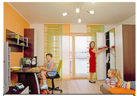
Musterhaus GENBÖCK KlimaGEN ein Passivhaus - Jugendzimmer

Selbst erleben können Interessierte das besondere Wohlfühlerlebnis eines GENBÖCK HAUS-Passivhauses jetzt im neuen KlimaGEN-Musterhaus in Haag/Hausruck - Österreichs erstem Muster-Fertighaus in Passiv-Bauweise mit „klima:aktiv“-Zertifizierung. Die energieschonende, FCKW-freie Produktion aller Bauteile entspricht hier ebenso dem „klima:aktiv“-Gebäudestandard wie der nachhaltig gesenkte Energieverbrauch mit entsprechender