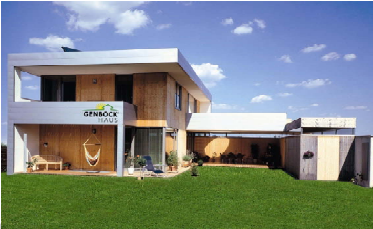
Ein GENBÖCK HAUS