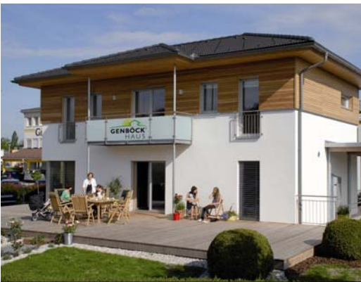
Musterhaus GENBÖCK KlimaGEN - ein Passivhaus am Firmenstandort Haag/Hausruck in Oberösterreich

Offiziell bestätigt wurde die Kompetenz von GENBÖCK HAUS außerdem schon mit dem Energiepreis „Energy Globe 2000“ sowie durch die Auszeichnung mit dem Titel „Energie-Genie“, mit der das Unternehmen im Jahr 2008 für die herausragenden Passivhaus-Standards als Niedrigstenergiehaus gewürdigt wurde. Und nicht zuletzt ist GENBÖCK HAUS seit 2000 aktives Gründungsmitglied der IG Passivhaus Oberösterreich, einer Vereinigung von Firmen, die an der Entwicklung des Passivhauses maßgeblich beteiligt waren, und die nun gemeinsam an der Verbreitung der Technologie arbeiten.